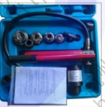
SYK-88 液压分离式穿孔工具