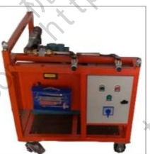
CQZ-45SF6 气体抽真空充气装置