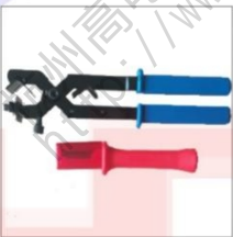
BX 0111 电缆剥皮工具