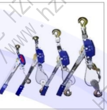
BQ 1000 紧线器