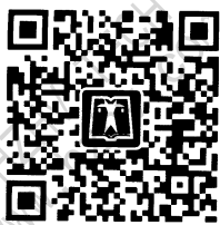
中国电力出版社官方微信