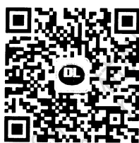
电力标准信息微信